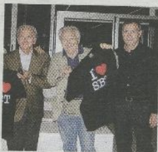
I promotori presentano il film

Così la Pro Loco presenta una produzione che intende valorizzare le bellezze locali